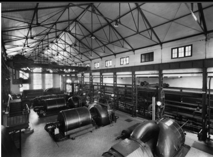
CDFEDP- Álbum Kurt Pinto CTII-06; 1938

Procurou-se recriar um pedaço da Sala do final da década de 1930, cujas fotografias da época capturaram para a posterioridade a claridade desse teto.