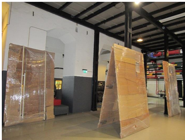
A chegada dos painéis do quadro sinóptico à Central Tejo

Os 10 painéis que compõem o quadro sinóptico passivo do Despacho da Distribuição de Energia Elétrica da Amadora do Grupo EDP entraram no dia 12 de julho de 2018 na Central Tejo para serem instalados na zona dos Condensadores.