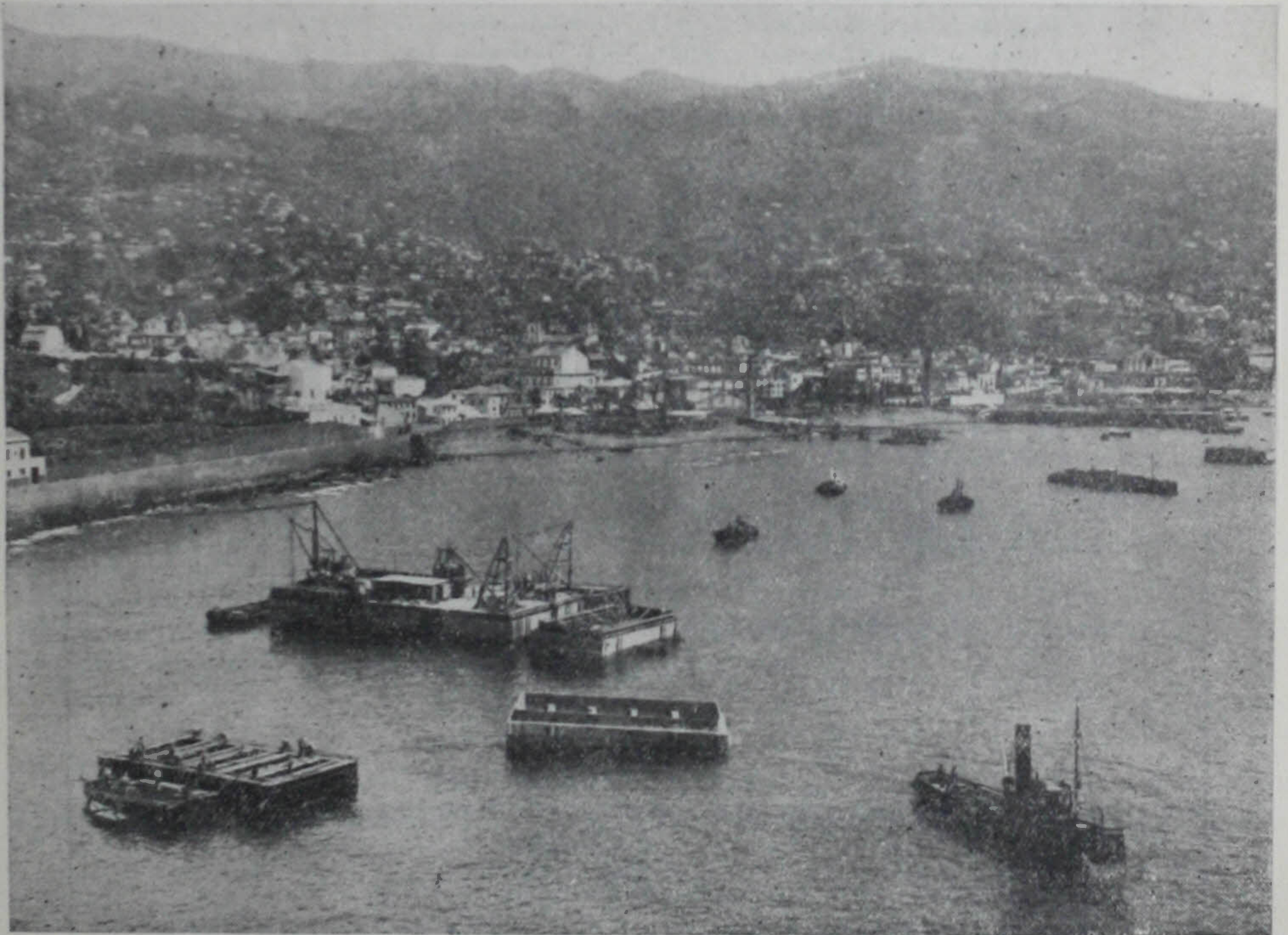
Pôrto do Funchal — Construção da nova ponte-cais

Telefones: 28201, 28202 e 29166—Estado 397—Setúbal 283—Azeitão 404